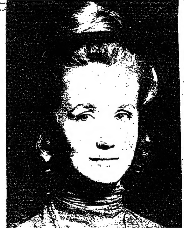
بريجيت نوسبي : راضات الفانس

يبدو الممثلة الفرنسية بريجيت نوسبي التي تصعد حالياً سلم الشهرة بسرعة كبيرة قادرة على القيام بجميع « ابن رشد » في طبعه سوفياتية ظهر في مؤسرة كتاب من فيلسوف القرون الوسطى ابن رشد ، مؤلفه ارنو سكتيف ، البحث المعروف في فلسفة بلدان الشرق . وقد أصدرته دار النشر « بيسل » . وقالت « نوسبي » : ان اسم ابن رشد ، اعظم فيلسوف في القرون الوسطى ، معروف على نطاق واسع بالنسبة لكل المهتمين بالمسائل الفلسفية وتاريخ البلدان العربية . وتعتبر اصله نسبة للفكر الفلسفي للشرق الإسلامي في القرون الوسطى . ان ابن رشد ، يمثل فكرة العقلية الاسلامية واكثر مما يمثل للاتجاه المادي في تطور الفلسفة العربية . لقد استلحق ابن رشد من تعاليمه اوسى وانماه ، اوفر الاستنتاجات ان كراهه اثرت تأثيراً هائلا على تطور للتعاليم الفلسفية لشرق أوروبا في القرون ١٢ - ١٦ . وتتلخص قيمة الفلسفة العقلية ايضا في انها تعرف اوساخا واسعة من القراء السوفيات بترت الفكر العربي في القرون الوسطى ، وسامعه في التعريف على ايجاد الماضي للشعوب العربية .